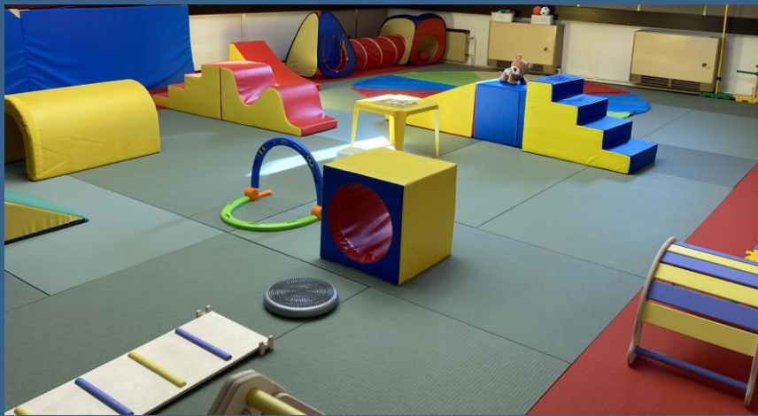
Malá ukázka naší tělocvičny